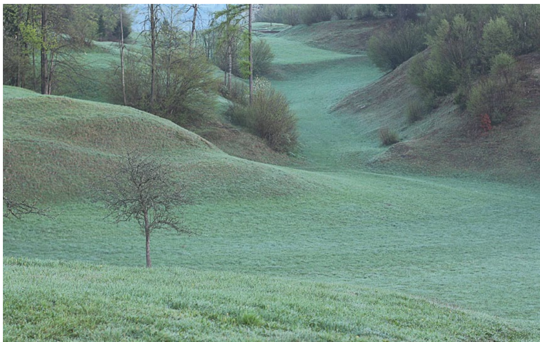
Ana Pečar , Planota, 2015, fotografija