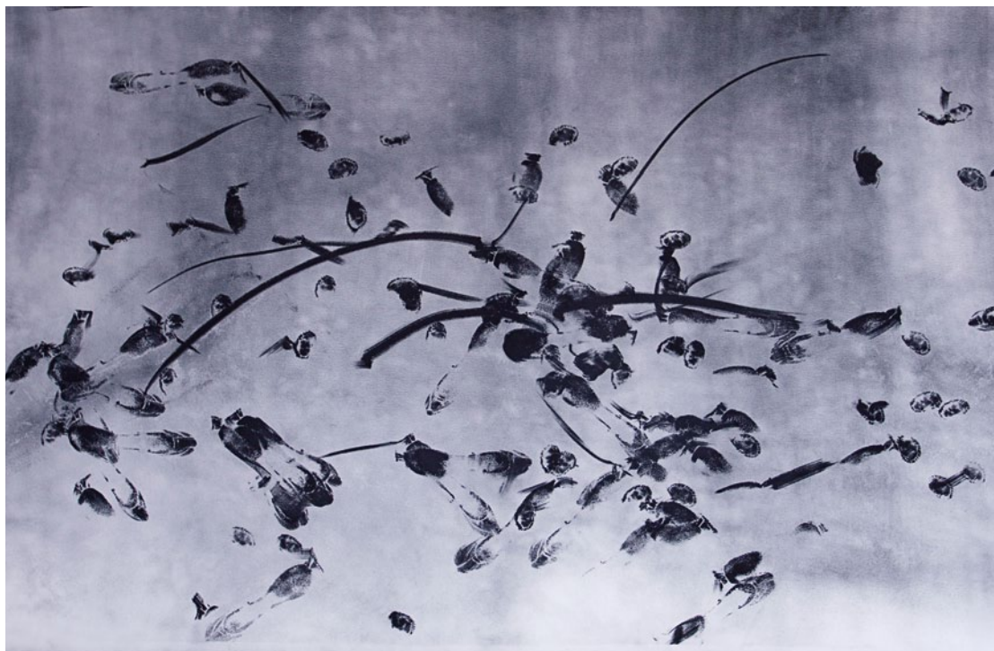
Luis Casanova Sorolla , Plesni odtisi Luidmile Konovalove, 2013, naravni pigment na papirju, 114 x 250 cm