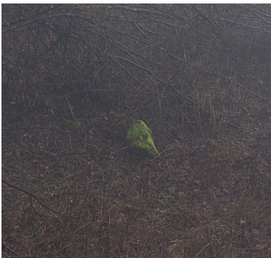
Ana Pečar , Premor, 2015, fotografija